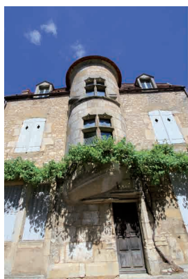
La Tourelle Gaillon Tour du 15e en encorbellement (rue St-Pierre)

A Vézelay, Moyen-Âge et modernité se côtoient. Les vieilles maisons étagées à flanc de colline sur de magnifiques caves voûtées qui, aux siècles passés, accueillirent les pèlerins, les ruelles serpentant à travers les jardins, le chemin de ronde et les anciennes portes... Tous ces charmes font de Vézelay un des plus beaux villages de France.