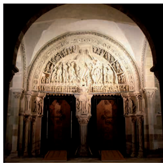
Le narthex Situé avant la nef, lieu de préparation au recueillement des pèlerins, au centre le grand tympan du Christ en gloire

Depuis 2005, on peut se rendre à pied à Assise en Italie, ville natale de saint-François, fondateur de l'ordre franciscain.