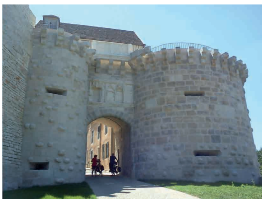
La Porte neuve Porte fortifiée du 16e située sur les remparts Nord