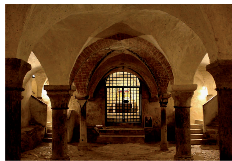
La crypte Située sous le chœur, conserve les reliques de Marie-Madeleine