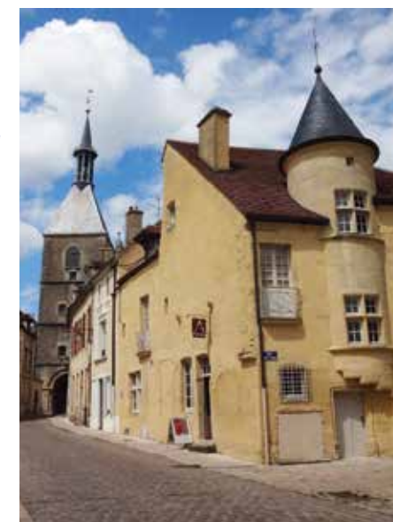
jardin-terrasse, quartier historique, marché