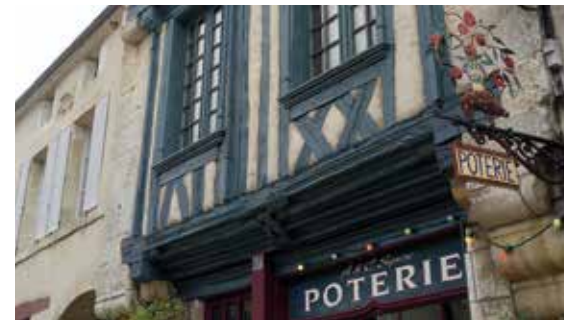
Ruelles de Noyers, le Serein