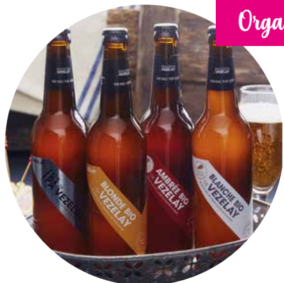
Organic artisanal beer